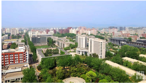
△俯瞰中国人民大学校园。

2014年5月4日，总书记在北京大学考察时强调，“我们要认真吸收世界上先进的办学治学经验，更要遵循教育规律，扎根中国大地办大学”。