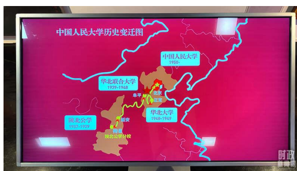
△中国人民大学的歷史变迁展示。

中国人民大学还是一所以人文社会科学为主的综合性研究型全国重点大学，历来重视人文社会科学高等教育和马克思主义教学与研究，被誉为“我国人文社会科学高等教育领域的一面旗帜”。