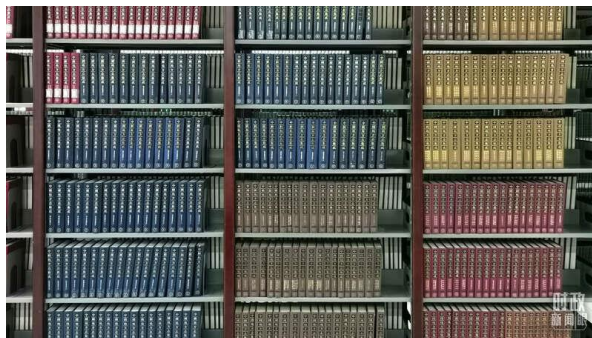
△图书馆收藏的地方志展示，目前共计 5441 部。