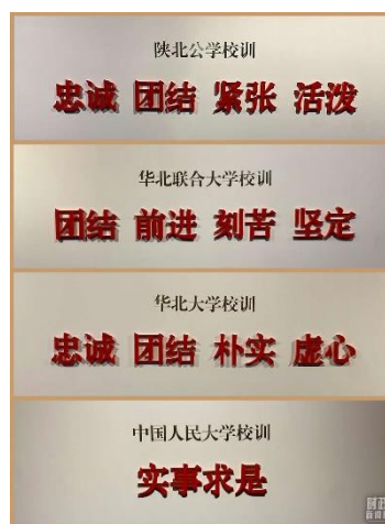
△中国人民大学（自1937年至今）的校训变迁展示。

在考察中，总书记再次强调，建设中国特色、世界一流大学不能跟在别人后面依样画葫芦，简单以国外大学作为标准和模式，而是要扎根中国大地，走出一条建设中国特色、世界一流大学的新路。