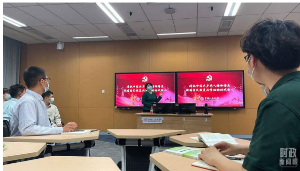
△当天的思政课教学课堂。

在人大校园的这个思政课堂上,总书记指出,思政课的本质是讲道理,要注重方式方法,把道理讲深、讲透、讲活,老师要用心教,学生要用心悟。他希望人民大学为全国大中小学思政课教学提供更多“金课”。