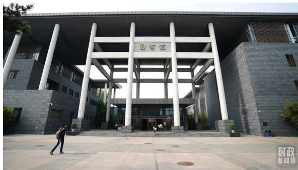
△中国人民大学图书馆。

在 4 月 25 日的考察中，习近平总书记来到中国人民大学图书馆。该馆以人文社会科学学术性文献馆藏为主，有藏书 410 余万册。