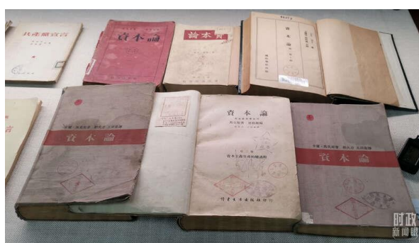
△人民大学珍藏着多个译本的《资本论》。

十年前，2012年6月19日，时任国家副主席的习近平在中国人民大学调研时，就特地考察了该校的《资本论》教学研究中心。