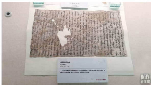
△图书馆内，粟特语信函展示。这封信勾勒出公元8世纪粟特商人在东方的商业网络，反映了唐代贸易繁荣的景象。