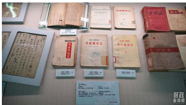
△图书馆内，《共产党宣言》多个译本展示。

2016年5月17日，总书记在哲学社会科学工作座谈会上指出，历史表明，社会大变革的时代，一定是哲学社会科学大发展的时代。当代中国，正逢其时。总书记说：“这是一个需要理论而且一定能够产生理论的时代，这是一个需要思想而且一定能够产生思想的时代。我们不能辜负了这个时代。”