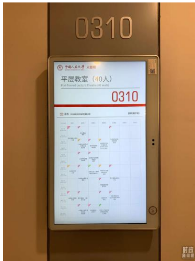
△教室门口的电子屏上，显示该教室的当周课表。