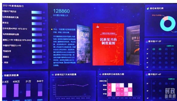
△图书馆电子屏实时显示座位使用比例、书籍借阅排行等。

觉以回答中国之问、世界之问、人民之问、时代之问为学术己任，以彰显中国之路、中国之治、中国之理为思想追求，在研究解决事关党和国家全局性、根本性、关键性的重大问题上拿出真本事、取得好成果。