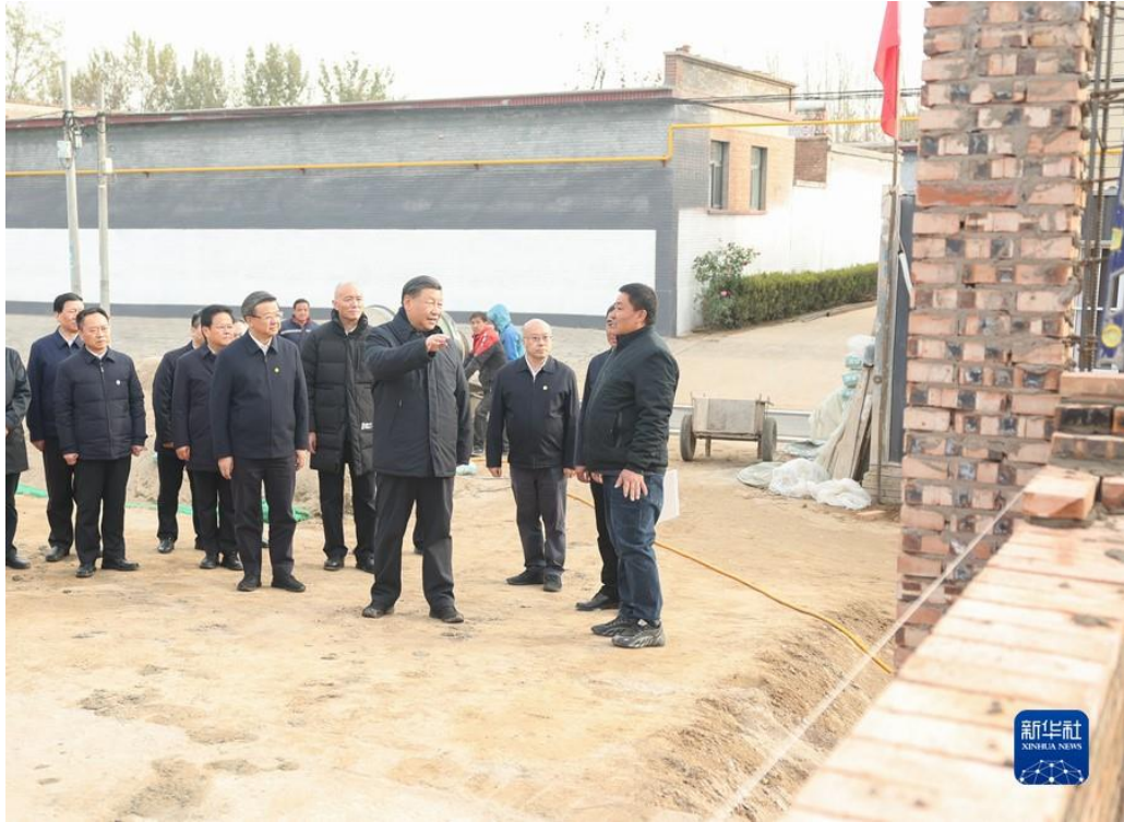
▲ 11月10日，中共中央总书记、国家主席、中央军委主席习近平在北京、河北考察灾后恢复重建工作。这是10日下午，习近平在河北保定涿州市刁窝镇万全庄村房屋重建施工现场考察。新华社记者 鞠鹏 摄 11月10日，中共中央总书记、国家主席、中央军委主席习近平在北京、河北考察灾后恢复重建工作。这是10日下午，习近平在河北保定涿州市刁窝镇万全庄村房屋重建施工现场考察。新华社记者 鞠鹏 摄