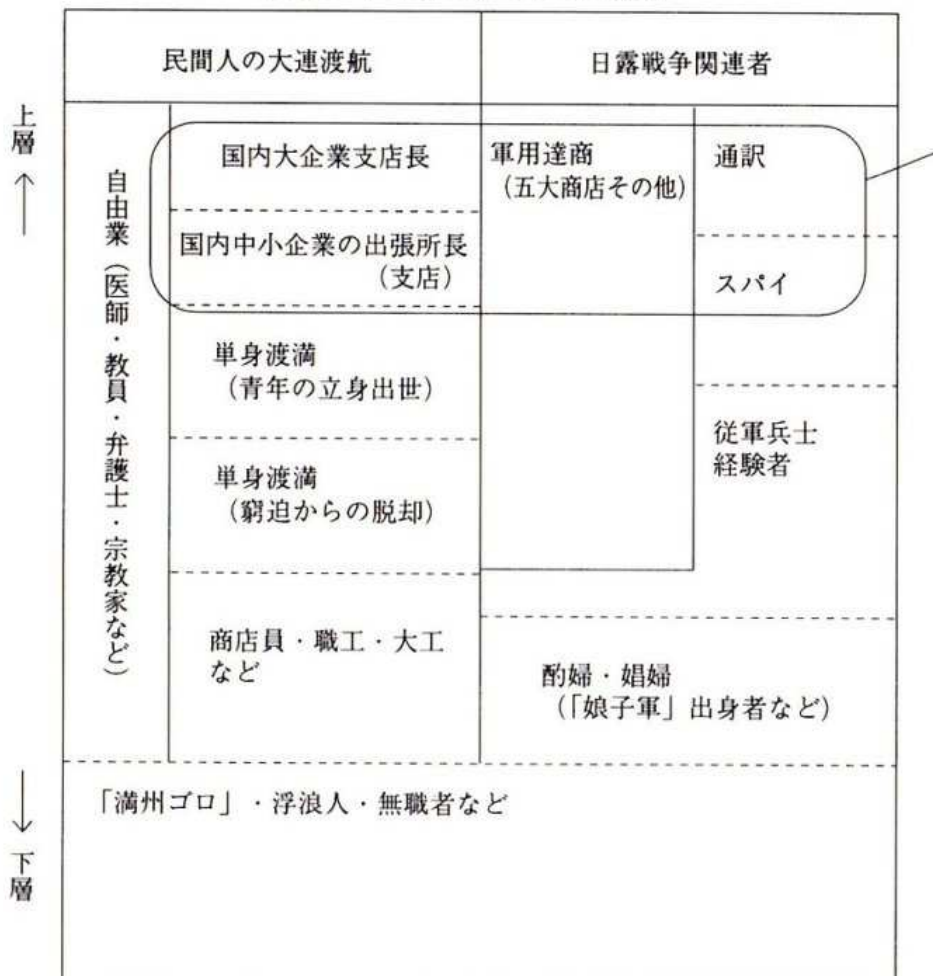
図 1 1910年前後の大連在留日本人営業者

还有一些人，比如木匠，石匠，店员，宣教师等，也都期待着在城市的新建时期，能找到合适和长久的工作。最后要提到一批人，是日本国内下层社会的流浪者和失业者。这些人是为了寻找活路，把赌注下在了大连。